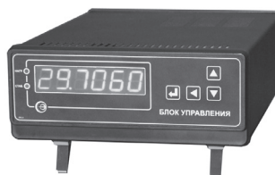
Блок управления БУ-7-4